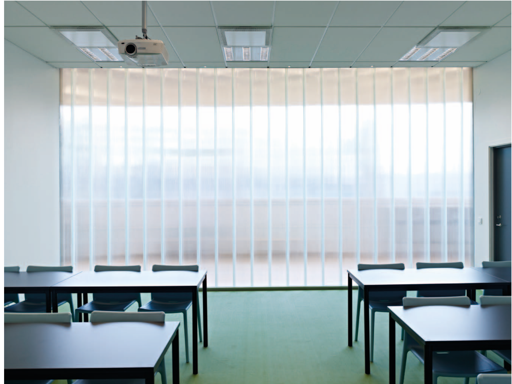
TILLFÄLLIGA MATERIAL. Stadsmissionens skola har framförallt lättviktiga och återvinningsbara material.

”OM ARKITEKTEN VILL INITIERA EGNA PROJEKT ÄR TILLFÄLLIG ARKITEKTUR RÄTT VÄG ATT GÅ.”