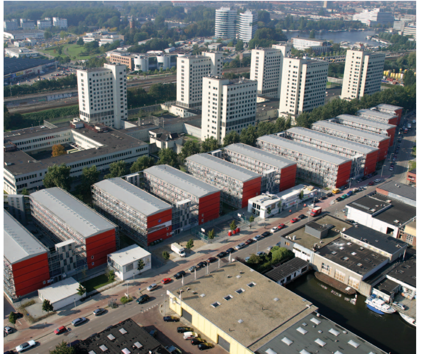
TEMPORÄRT PERMANENT. Studentkvarteret Keetwonen i Amsterdam är Europas största containerstad. Projektet förlängdes nyligen och ska stå kvar till 2016 – minst.

– Det lönar sig mer att anlita en arkitekt för att skapa något tillfälligt eller en flyttbar lösning.